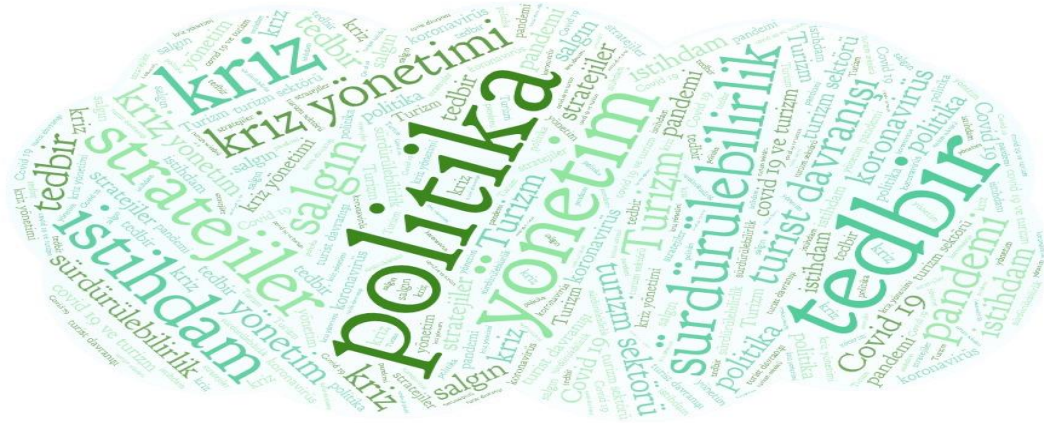
Şekil 1: Kelime Bulutu

Tablo 6 incelendiğinde toplam kullanılan anahtar kelime sayısının 291 olduğu sonucuna ulaşılmaktadır. "Covid 19" anahtar kelimesi 49 kez kullanılarak 1. Sırada yer alırken, "Turizm" kelimesi 27 kez kullanılarak 2. Sırada yer almaktadır. Turizm politikalarının yoğun olarak ele alındığı çalışmalarda kullanılan anahtar kelimelere baktığımızda ise "politika", "turizm politikaları", "stratejiler", "turizm kurtarma stratejisi", "kanıta dayalı politika", "ulusal turizm stratejileri", "yönetim" kelimelerinin çoğunlukta olduğu görülmektedir.