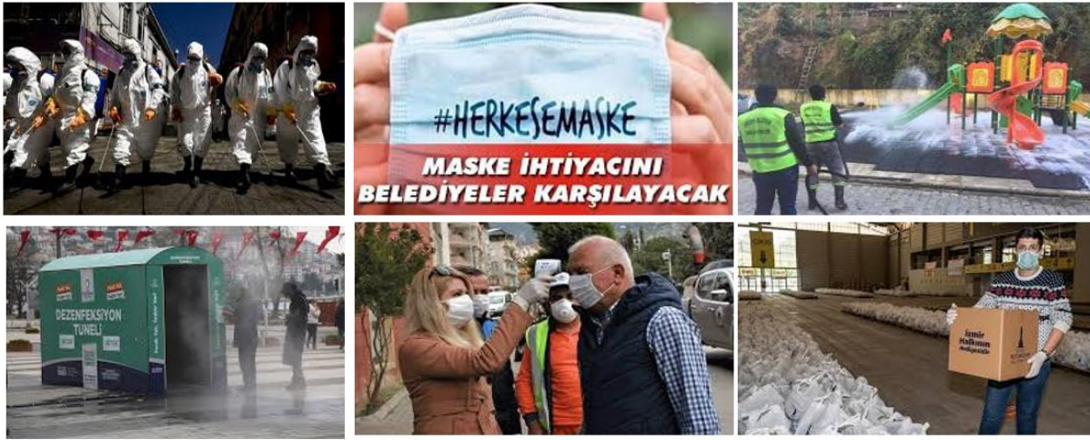
Şekil 3: Covid-19 Salgınında Belediyeler Tarafından Yapılan Temizlik ve Yardım Hizmetleri

Pandemi adından da anlaşılacağı üzere Covid-19 virüs yayılımı küresel bir olaydır. Dolayısıyla bilgi akışının ülkeler arası akışı ön plana çıkmaktadır. Sadece kendi kentimizde değil; diğer dünya ülkelerinin kentlerinde salgının durumunu izlemek gerekliliği doğmuştur. Bazı kentlerde karantinalar olmuş; hatta ülkeler arası sınırların kapanması durumu yaşanmıştır. Bilgi iletişimin önemi ön plana çıkmıştır. Bu nedenle salgın süreci bizlere az temasla ve teknolojiyle hizmet alabileceğimiz akıllı kentlerin gerekliliğini göstermiştir. Her türlü kentsel hizmet sürecinin mümkün olduğunca teknoloji tabanlı çözülerek zaman, para, mekân tasarrufu sağlanması sonucu yaratabilen akıllı kentlerin, aynı zamanda sosyal mesafe bakımında da olumlu olabileceği anlaşılmaktadır. Yerel yönetimlerin çağa uygun kentsel hizmetlerinden biri de kent bilgi sistemleridir. Bu hizmette akıllı şehir yaklaşımıyla Covid-19 salgını adına farklı hizmetlerle birleşmiş, telefon uygulamalarından kent planlarındaki vakalar gözlemlenebilir hale gelmiştir.