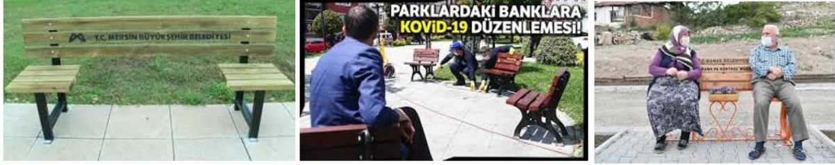
Şekil 4: Parklardaki Oturma Banklarına Covid-19 Önlemleri

Covid-19 bulaşma riskinin azaltılabilmesi için yaş aralıklarına göre saat planlaması yapılmaktadır. 65 yaş ve üzeri kentliler 10.00-13.00; 20 yaş altı çocuk ve gençler ise 13.00-16.00 saatleri arasında dışarı çıkabilmektedir. Bu durum kentsel mekân kullanıcılarının profilini değiştirmiştir. Torunlarını gezdirmeye parka getiren yaşlılarımız bu durumdan mahrum kalmakta; aile ilişkileri görüntülü telefon konuşmalarıyla sağlanmaya çalışılmaktadır. Vaka sayılarının artış gösterdiği anlaşılınca hafta içinde saat 21.00 sonrası ve de Cumartesi Pazar günleri sokağa çıkma yasağı ilan edilmiştir. Bu durum kentsel yaşamı olağan dışı bir hale sokmaktadır. Şehrin toplumsal yapısının ötesinde kentsel ve ülkesel ekonomide de sıkıntılar meydana gelmektedir. Bu nedenle merkezi yönetim ile yerel yönetim ortaklıklarının artırılması ve destek politikalarının geliştirilmesi beklentileri doğmaktadır.