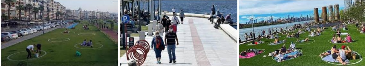
Şekil 2: Covid-19 Sürecinde Kentlerde Açık Alan Kullanımı Görüntüleri

Yerel yönetim hizmetlerinin önemli konularından biri olan kentsel altyapı konusu daha çok gündeme gelmektedir. Evlerde daha çok zaman geçirmek durumunda olan kentlilerin su kullanımları artmakta; kentsel altyapı ihtiyaçları da daha önemli hale gelmektedir. Hijyen nedeniyle suya talebin arttığı bu dönemde barajlardaki doluluk oranları konuşmalarının yapılması bile kaygı düzeyini artırmaktadır. Bu durum doğal kaynakların tüketimine ve kişi başına düşen yeşil alan miktarına dikkat edilmediği yakın geçmiş kentleşmesine cevap niteliğinde olarak değerlendirilebilir. Covid-19 pandemisi sürdürülebilir kentlerin önem ve gerekliliğini ön plana çıkarmış; sürdürülebilir kentsel planlamanın değerini gözler